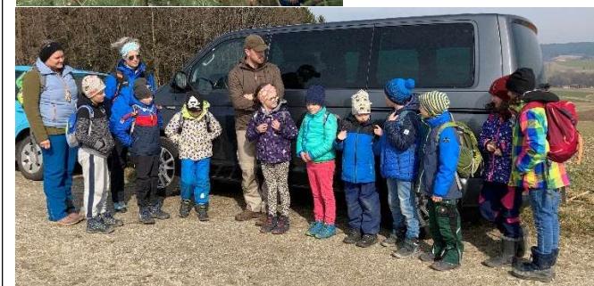
Heimstunde 25.03.2022 Panda Padge-Champions for nature -Insektenhotel bauen