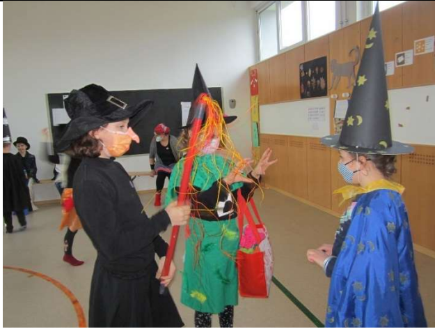
Tolle Verkleidungen haben sich die WiWö wieder einfallen lassen.